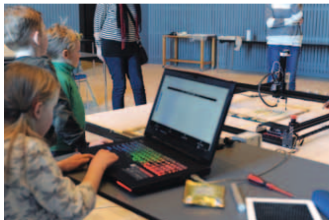
Besökare styr akvarellroboten från en datorskärm.

När robotar som redskap blir mer tillgängliga för allmänheten kommer de förmodligen fungera som en förlängning av oss själva på olika sätt. Precis som penseln idag gör det enklare för oss att måla istället för att använda fingertopparna. Allt handlar om vilket uttryck man söker och att därefter välja ett lämpligt redskap för att nå dit. Jag hoppas också att vi kan låta barn få arbeta mer med robotar i olika former då man snabbt får nya och helt oanade infallsvinklar. Det är ju de som kommer att skapa framtiden och den kommande konsten.